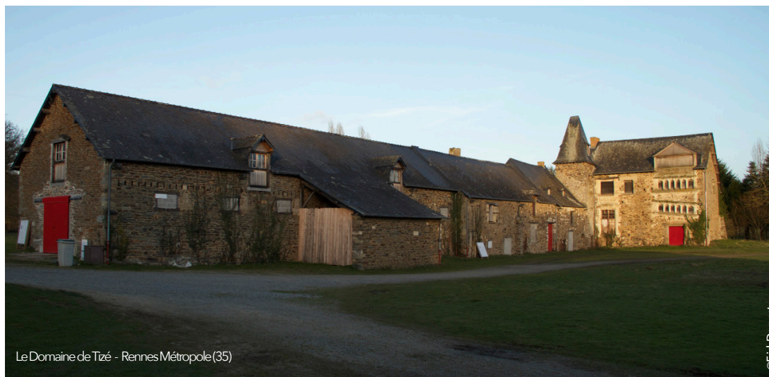
Le Domaine de Tizé - Rennes Métropole (35)

Au bout du plongeur héberge l'atelier communautaire de fabrication Pelleteurs de nuages qui peut accompagner la réalisation des projets.