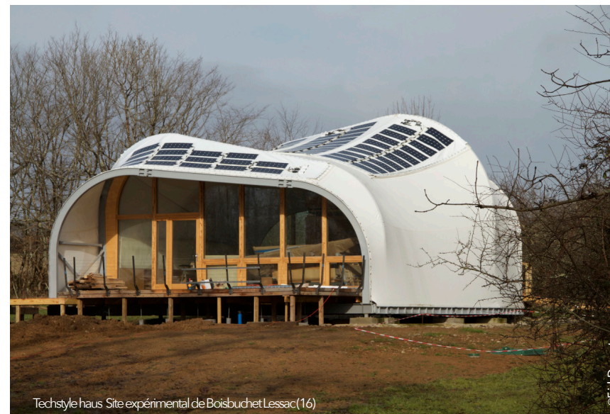
Techstyle haus Site expérimental de Boisbuchet Lessac(16)