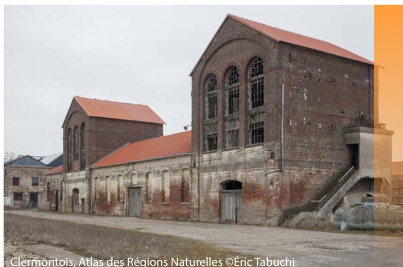
Clermontois, Atlas des Régions Naturelles

# Communs négatifs - Fardeaux socio-économiques - La France moche - Résilience