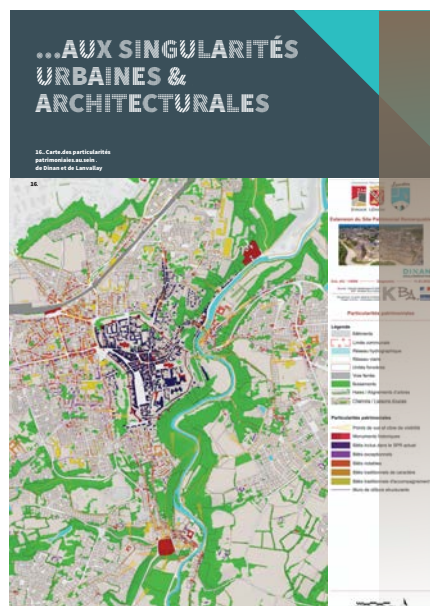
ZPPAUP Lanvallay - Dinan Agglomération

# Monument - Inventaire - SPR - Abords - Site inscrit - Site classé - Grand site de France - PNR - PLU