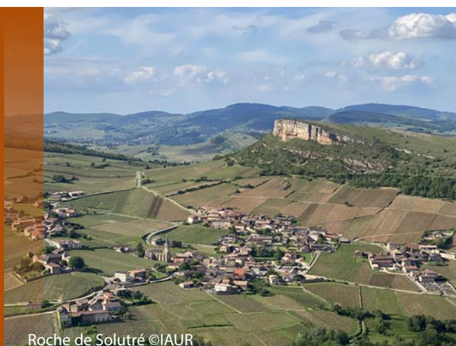
Roche de Solutré