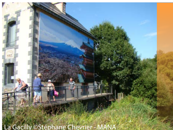
La Gacilly

# Sociologie - Identité - Mémoire - Imaginaire - Économie - Marketing territorial - Storytelling - Tourisme